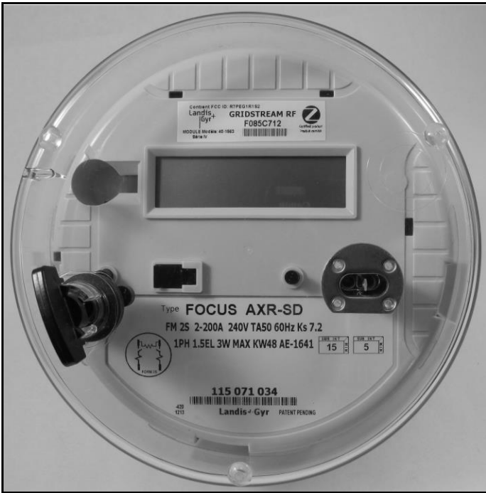
FOCUS AXR-SD Front View / Vue de face FOCUS AXR-SD