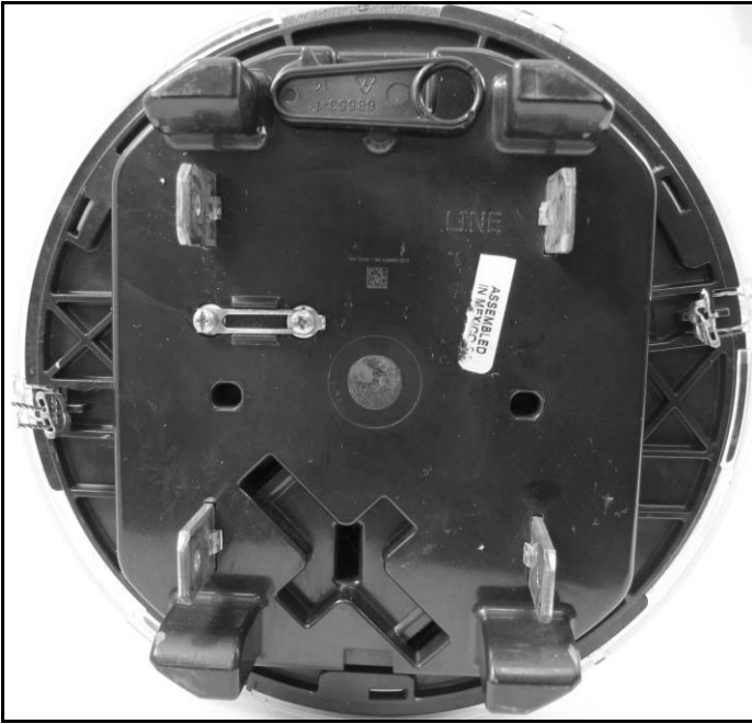
FOCUS AXR-SD sealing points / Points de scellage du FOCUS AXR-SD