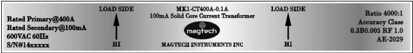
Revision / Révision 1