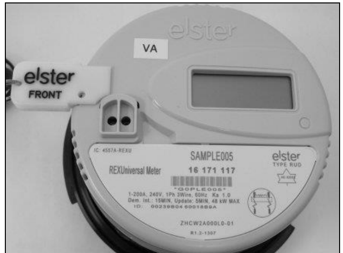
Meter with Programming Jumper / Compteur avec bretelle de programmation