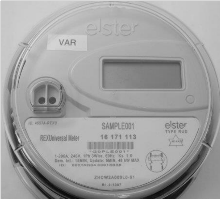
Frontview / Vue de face