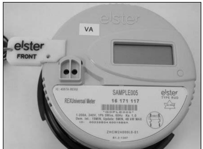
Meter with Programming Jumper / Compteur avec bretelle de programmation