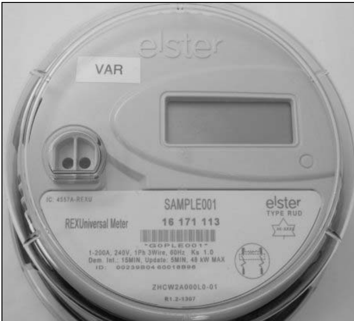
Frontview / Vue de face