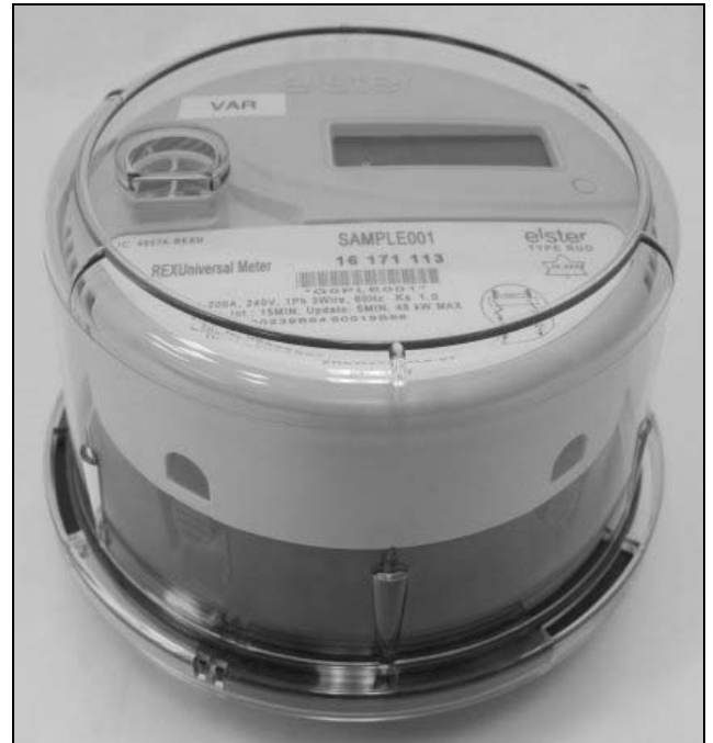
Sideview / Vue de côté