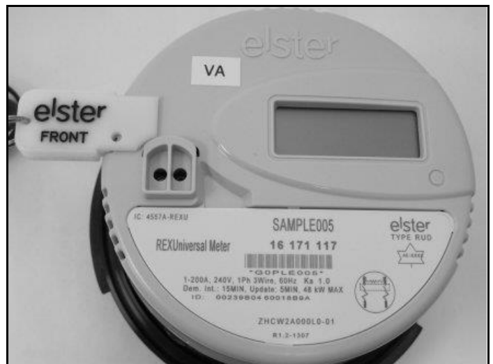
Meter with Programming Jumper / Compteur avec bretelle de programmation