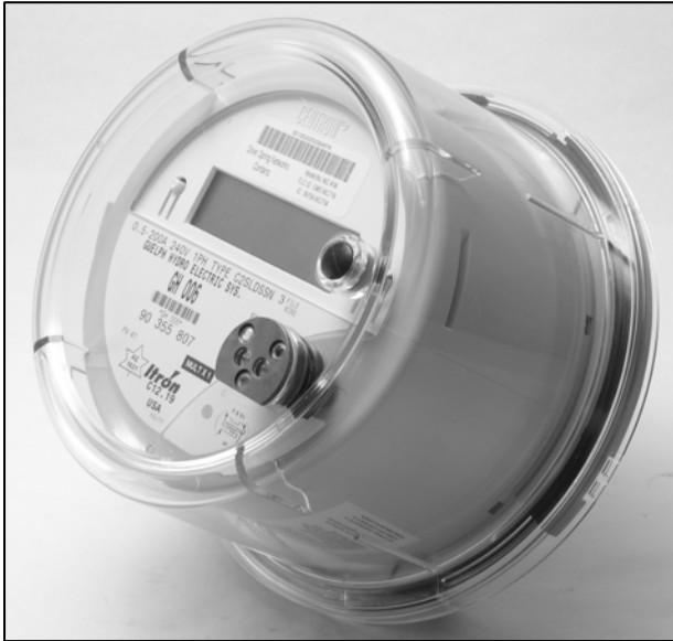
CENTRON II C12.19