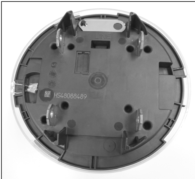
Sealed CENTRON II C12.19 with molded test link plug / CENTRON II C12.19 scellé avec bouchon du conducteur d'essai moulé