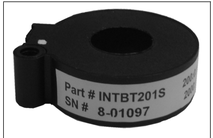
Alternative INTBT201S Cruuent Sensor / Capteur de courant INTBT201S alternatif