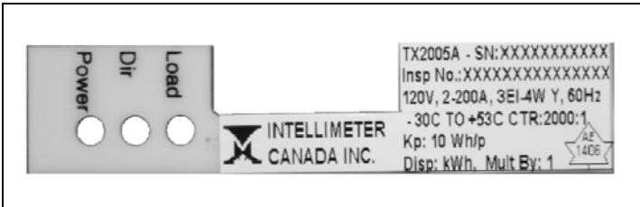
TX-2005A Nameplate / Plaque Signalétique du TX-2005A