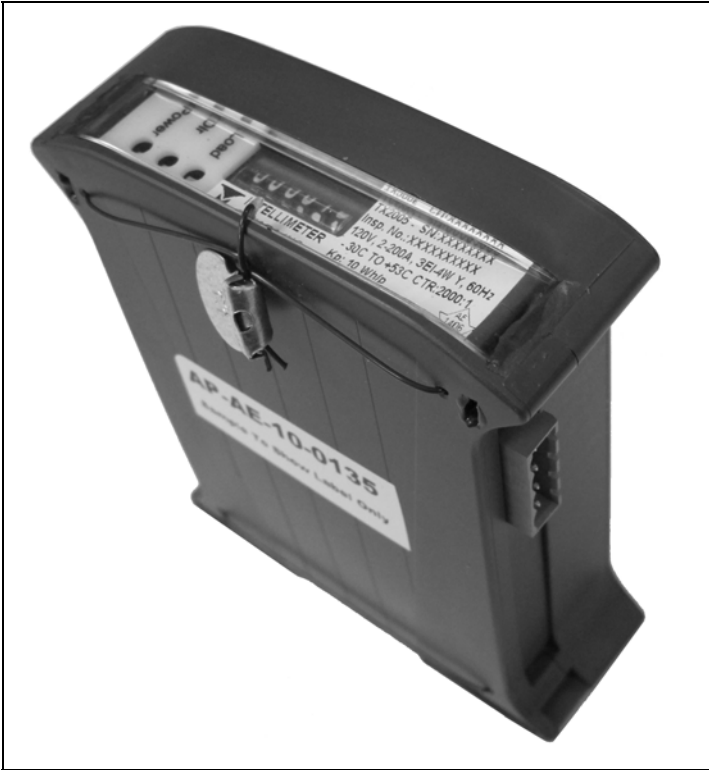
TX-2005A Meter / Compteur TX-2005A