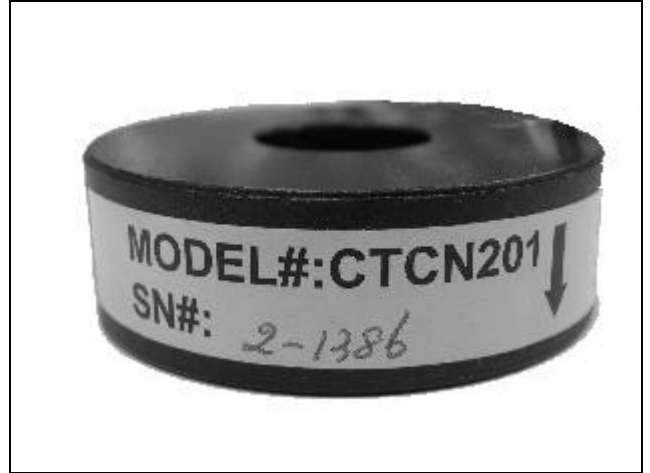
CTCN201 Current Sensor / Capteur de courant CTCN201