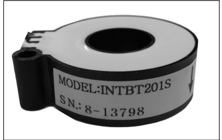
INTBT201S Current Sensor / Capteur de courant INTBT201S