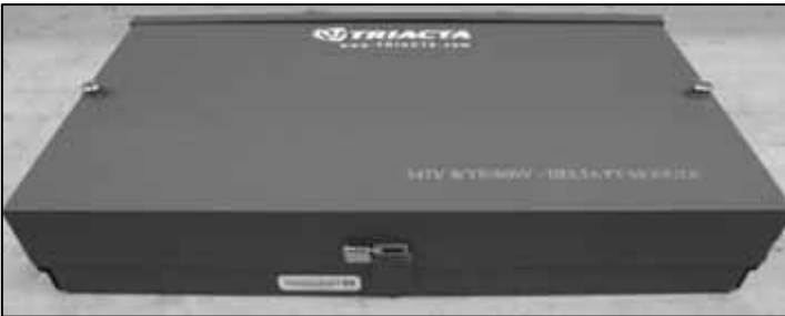
Triacta Voltage Transformer / Transformateur de tension de Triacta