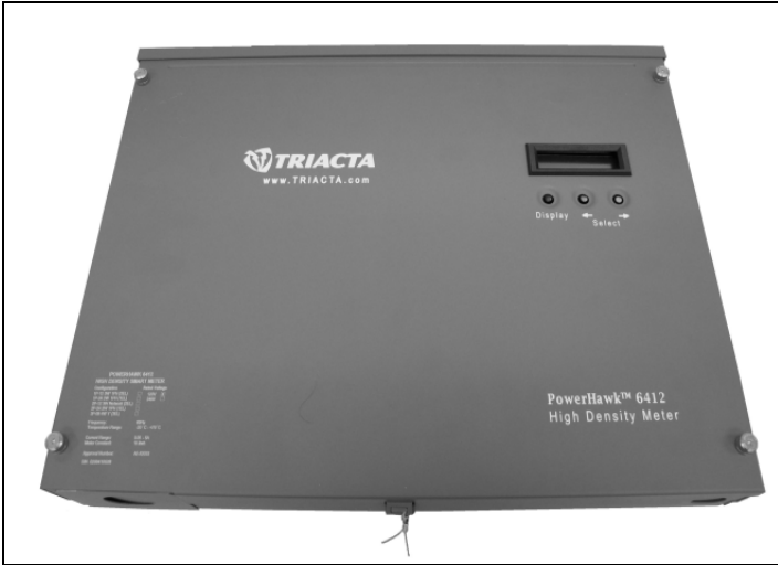
PowerHawk 6412 Meter / Compteur PowerHawk 6412