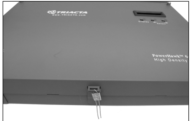
Utility Sealing Location / Emplacement du sceau d'utilité