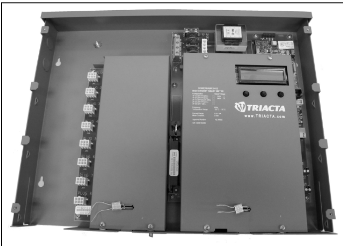
Metrological Sealing Locations / Emplacements des sceaux métrologiques