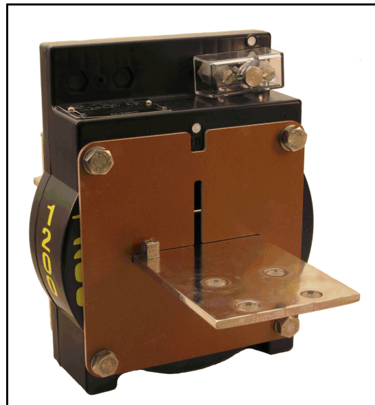
Type of Transformer DCEB / Transformateur de Type DCEB