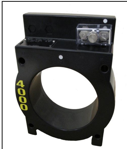
Type of Transformer DCEW / Transformateur de Type DCEW