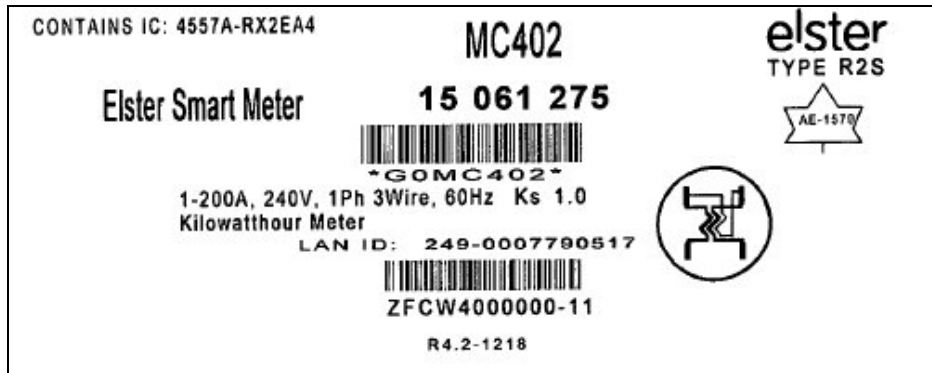
Nameplate / Plaque signalétique