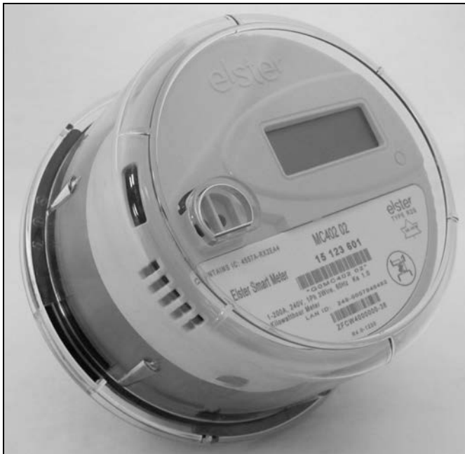
R2S Meter / Compteur R2S