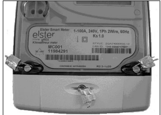
Sealing of the gREX meter / Scellage du compteur gREX