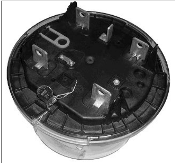
Sealing of the R2S or R2SD meter / Scellage du compteur R2S ou R2SD