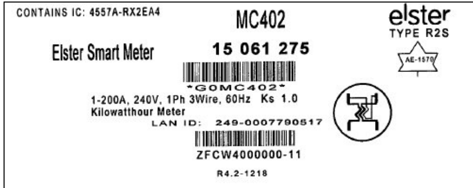
Nameplate / Plaque signalétique