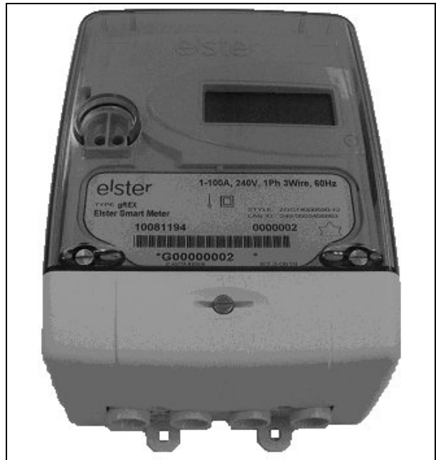
gREX Meter / Compteur gREX