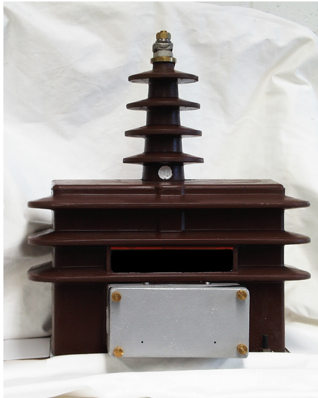
RATIO 120 : 1