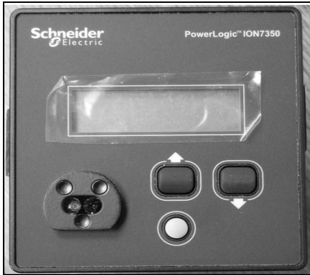
ION 7350 with Schneider Electric branding / ION 7350 avec la marque Schneider Electric

Measurement: Canada Approval Number: AE-0788 Transformer Type: 2-element / 3-element wye Temperature Range: 0-55C PB-0005Aux1-11